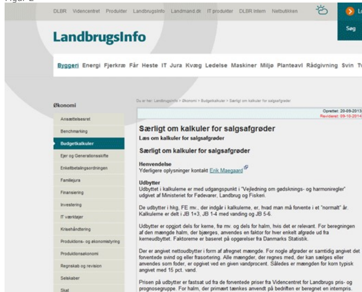
Figur 2 Der er mulighed for at indlejre en anden webside til dokumentation af tabellerne i Farmtal Online